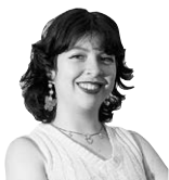
★ Anna Margoliner @marxoliner

Esta exposición temporal es una confrontación directa entre el arte moderno colombiano y un espacio marcado por la espiritualidad, el silencio y la disciplina femenina. Desde la mediación histórica, esta muestra reactiva preguntas sobre el cuerpo y la censura