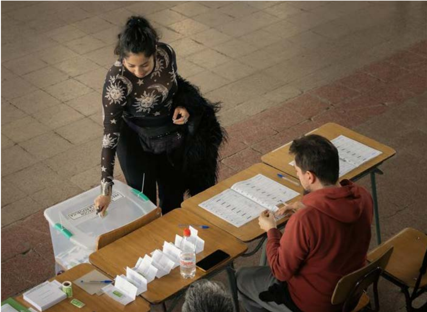
Elecciones presidenciales en Chile.

transición a una democracia representativa sin fundamento en lo social, es tarea que exige una capacidad disruptiva que implica un alto grado de unidad y lucha popular constante desde las comunidades, que impulse la transformación de las relaciones de poder.