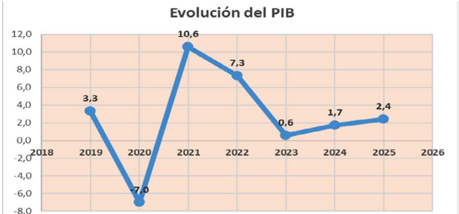
Fuente: Dane, 2025, pronóstico. Feunte Dane.