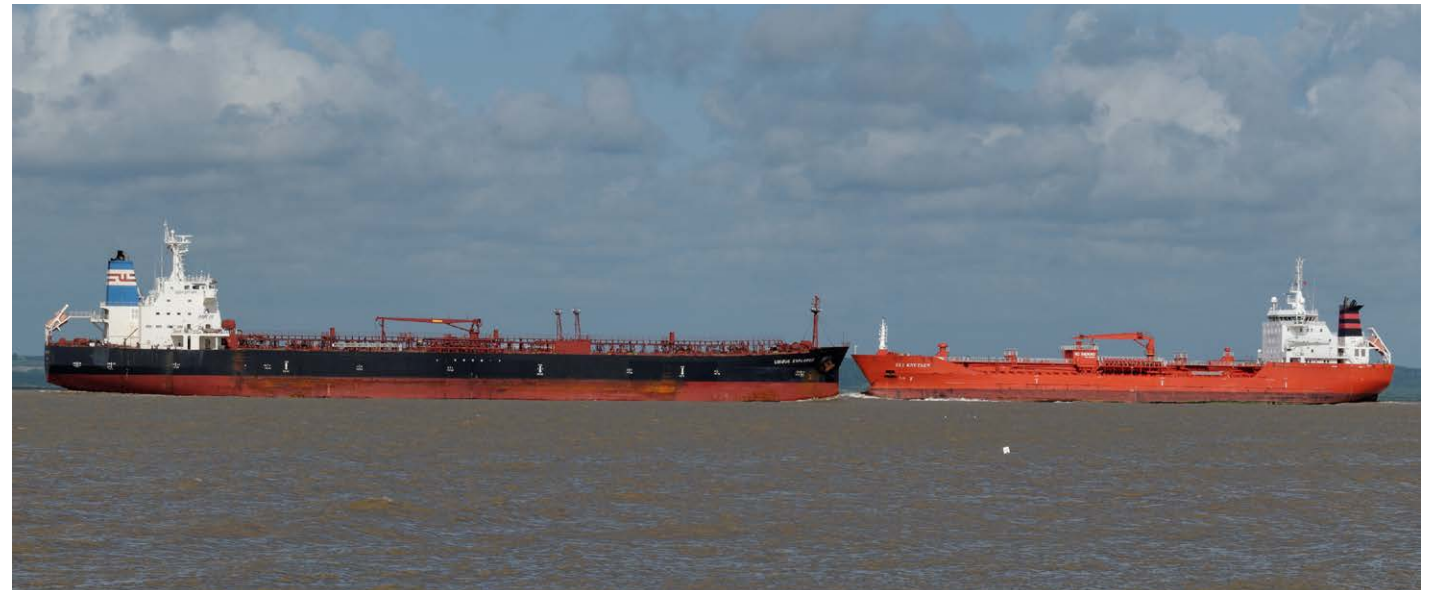
Buque petrolero.

“La República Bolivariana de Venezuela denuncia y repudia enérgicamente lo que constituye un robo descarado y un acto de piratería internacional, anunciado de manera pública por el presidente de los Es-