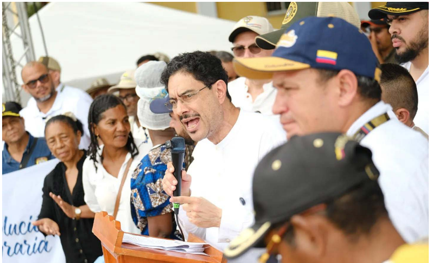
Intervención de Iván Cepeda Castro en concentración popular en San Onofre, Sucre.

año porque hoy lidera a la izquierda en su propósito por continuar con el proceso del cambio; es un símbolo en la lucha por la justicia y la memoria histórica, y es un referente en la búsqueda de la paz democrática y la solución política al conflicto social y armado.