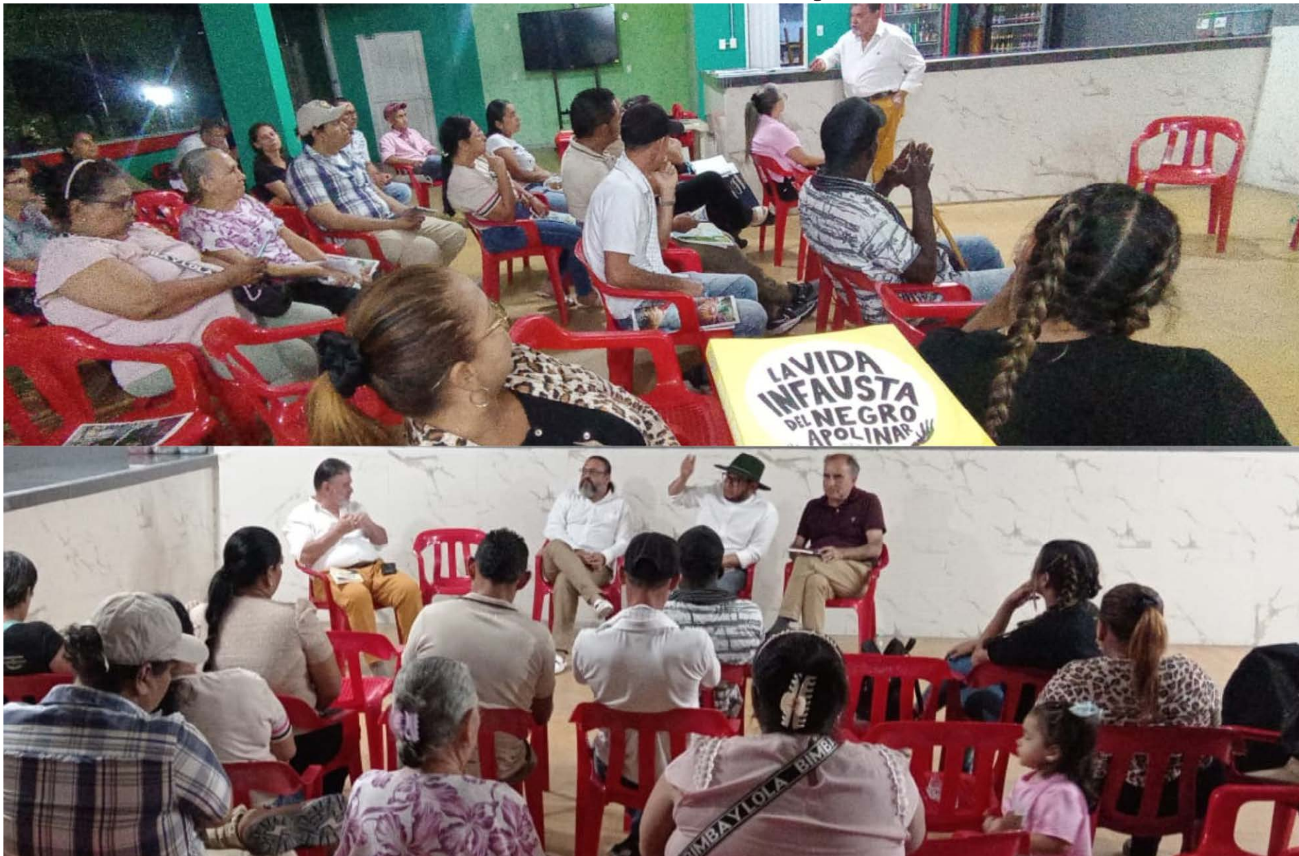
Se empezaron a colocar los cimientos para que Puerto Boyacá se le llame con justicia la capital de la paz de Colombia.