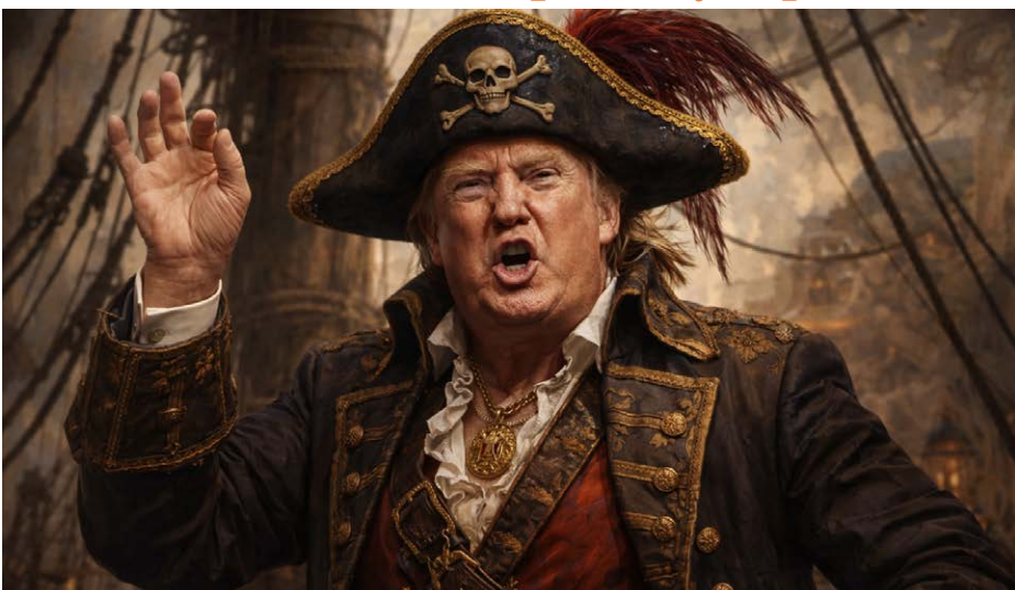
Trump, el nuevo pirata del Caribe.

También el canciller ruso, Serguéi Lavrov, dijo que su gobierno alberga la esperanza de que Washington, “por respeto a los demás miembros de la comunidad internacional, explique sobre la base de qué hechos está tomando estas medidas”. ★