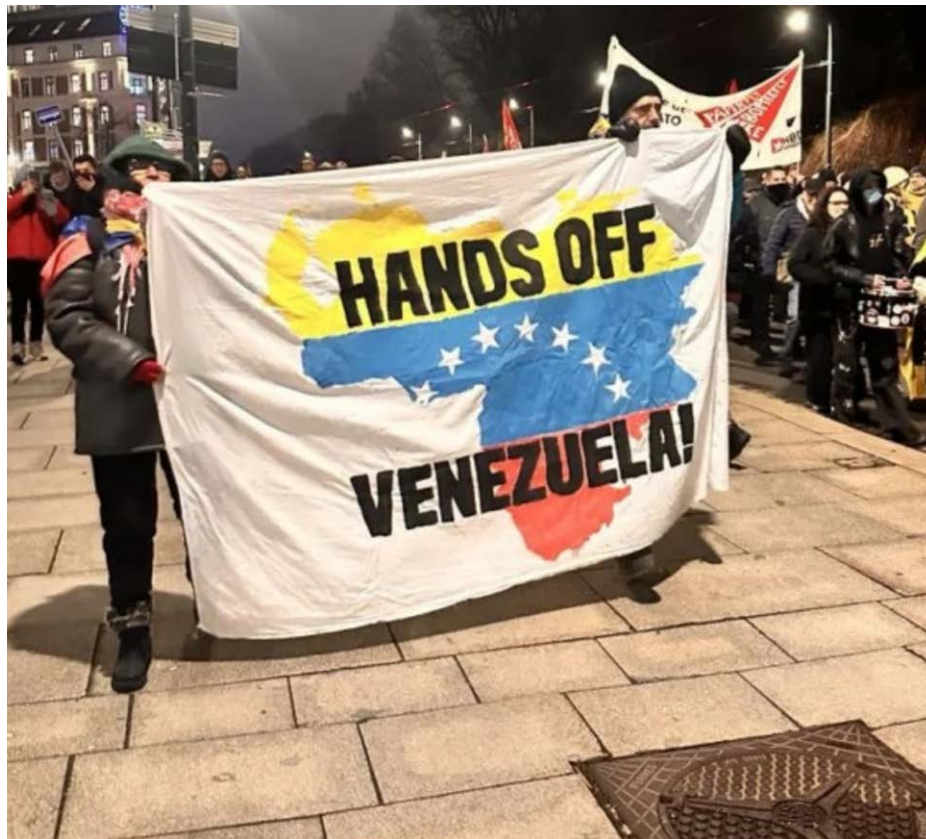
Protestas en Noruega contra la entrega del Nobel a María Corina Machado.

Machado adquirió notoriedad en abril de 2002 cuando firmó el denominado ‘Decreto Carmona’, emitido durante el golpe de Estado contra el entonces presidente Hugo Chávez, derrotado por una masiva movilización popular y de militares leales a la Revolución Bolivariana. El ‘Decreto