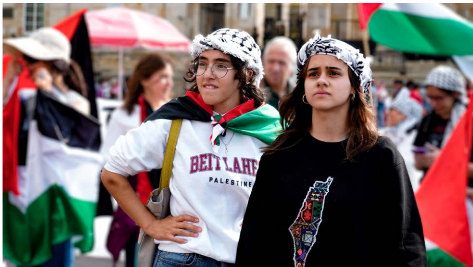
Solidaridad con Palestina.

Estos hechos desataron la campaña “Las cuchas tienen razón”. La frase nació de un mural en Medellín, pintado en enero de 2025, como un homenaje a las madres buscadoras de la Comuna 13 y como un símbolo de resistencia, memoria y solidaridad con las víctimas de desaparición forzada en Colombia.