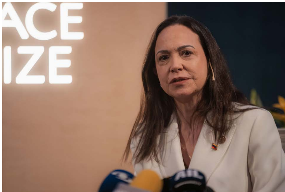
María Corina Machado.