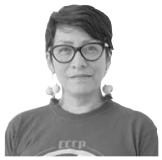
★ Claudia Flórez Sepúlveda @ClaudiaFlorezPC

F altan casi ocho meses de terminar el mandato del Gobierno del Cambio y el balance evidencia que Colombia avanzó en rupturas con el modelo neoliberal que durante décadas precarizó el trabajo, concentró la riqueza y profundizó la desigualdad social.