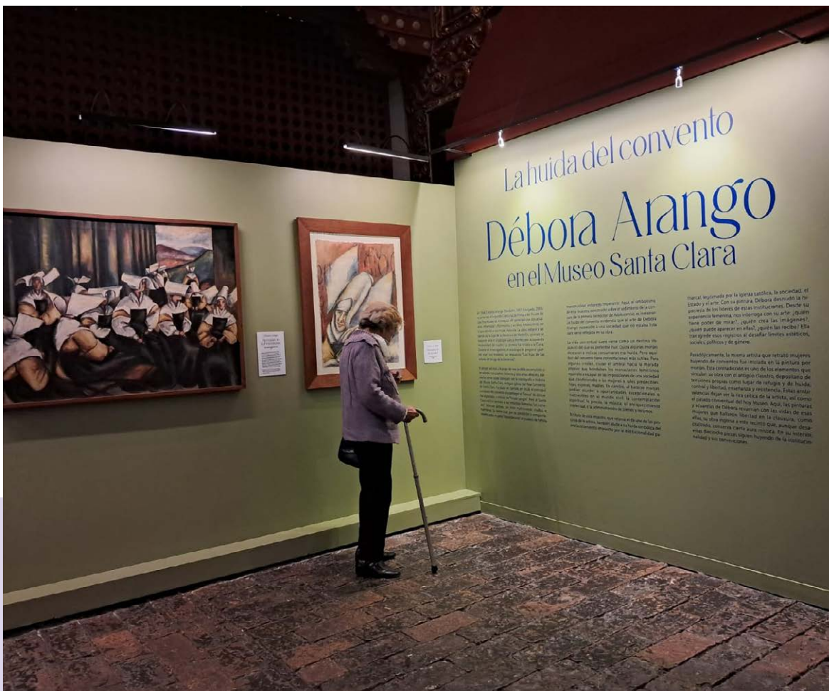
Cuerpos femeninos disidentes de Débora Arango ocupan el espacio histórico del Museo Santa Clara, antiguo convento de clausura.

D urante siglos, el edificio que hoy alberga el Museo Santa Clara fue un espacio de clausura. Fundado en el siglo XVII como convento para monjas clarisas, el lugar estuvo dedicado a la vida contemplativa, la disciplina religiosa y la separación del mundo exterior. Tras la ex-claustración en el siglo XIX, el inmueble fue declarado monumento nacional y, desde 1983, funciona como museo, conservando uno de los retablos barrocos más importantes de América Latina.