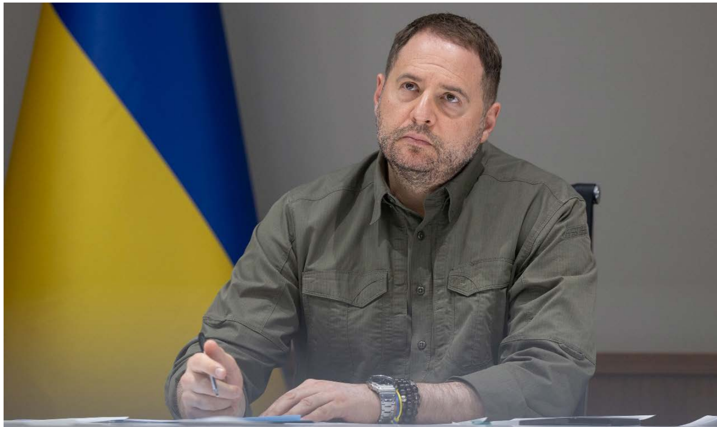
Andréi Yermak, exjefe de la Oficina del presidente Zelenski.

E l estallido de un escándalo de corrupción de proporciones colosales, que comprometen las entrañas mismas de la estructura de poder en Ucrania, y una precaria situación de las tropas del régimen, en todas las líneas del frente de batalla, que hace que ya no tengan iniciativa militar de relevancia, a lo que se suma el apresurado anuncio de Volodímir Zelenski de que convocará elecciones presidenciales en un tiempo prudencial, determinan las características principales de la crisis ucraniana al finalizar el año.