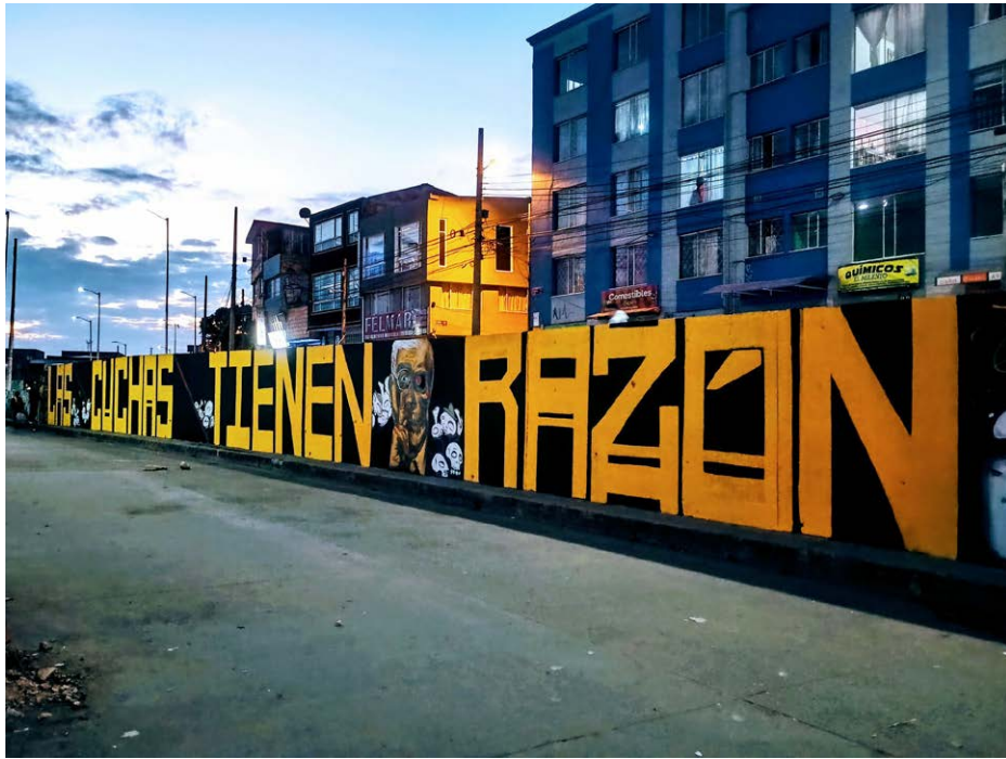
Mural “Las cuchas tienen la razón” en Soacha.

De acuerdo con estas acusaciones, que terminaron siendo confirmadas, en este sitio trágico de la Comuna 13 de Medellín se encontraría una fosa común a cielo abierto con los cuerpos de las personas detenidas, torturadas y ejecutadas extrajudicialmente por parte de las Fuerzas Armadas y estructuras paramilitares que se tomaron a sangre y fuego el enclave urbano.