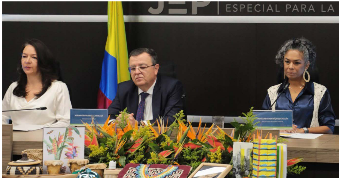
La magistrada Catalina Díaz (izquierda) de la Sala de Reconocimiento de Verdad, de la Jurisdicción Espacial para la Paz, JEP, leyó la imputación.

Con el caso de Apartadó, en 1996, se ejemplifica el patrón macrocriminal en el ámbito nacional: la destrucción del partido político UP por parte de miembros del Ejército Nacional en asociación con grupos paramilitares: “El genocidio en Urabá fue resultado de una política contra-insurgente que entendió que la derrota militar de las extintas Farc-EP requería la destrucción del partido político de la UP. Apartadó, capital