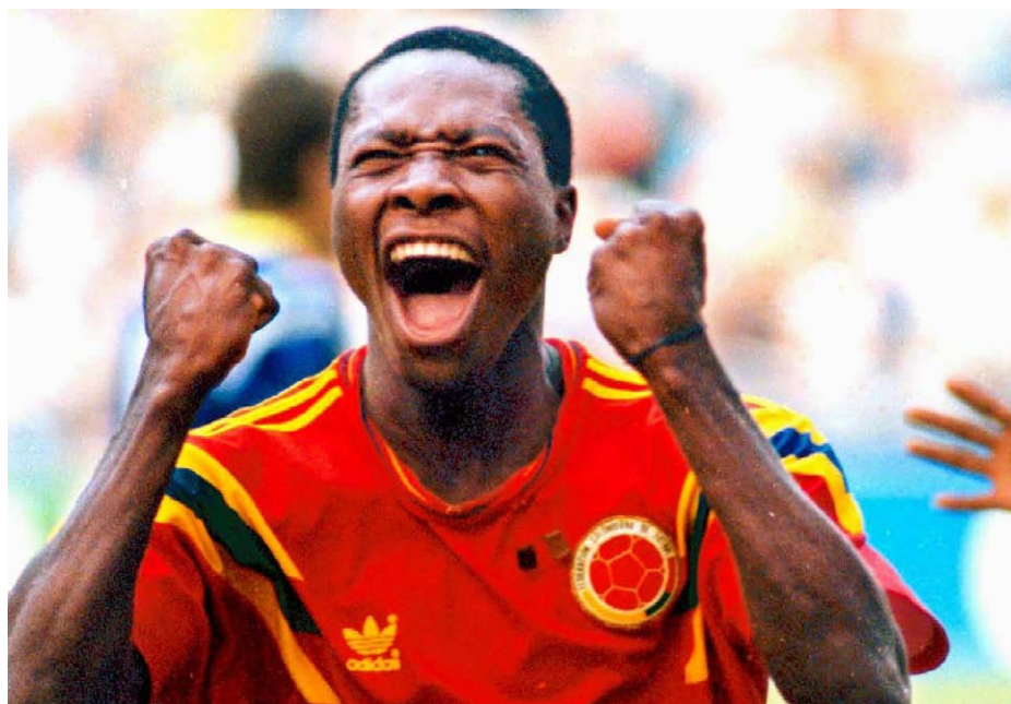
Freddy Rincón celebra el gol contra Alemania en el mundial de Italia 90.

El 11 de diciembre se estrenó en las principales salas de cine el largometraje documental ‘El Coloso’ que revive la historia de Freddy Eusebio Rincón Valencia, leyenda del fútbol colombiano y símbolo de los pueblos negros del Pacífico.